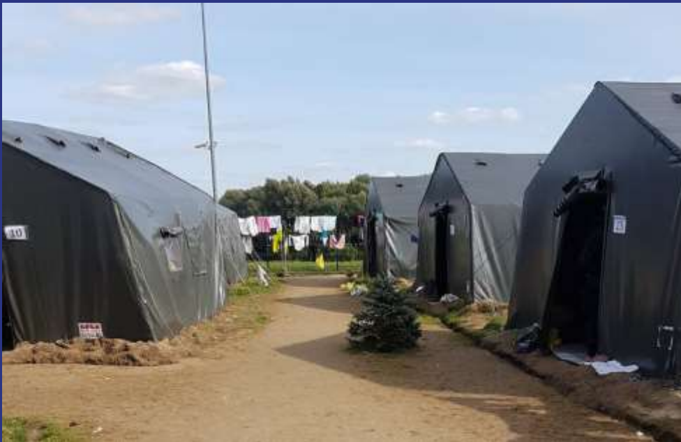
Švendubrės palapinių stovykla (jau likusi tuščia, migrantai iškelti į stacionarias patalpas)