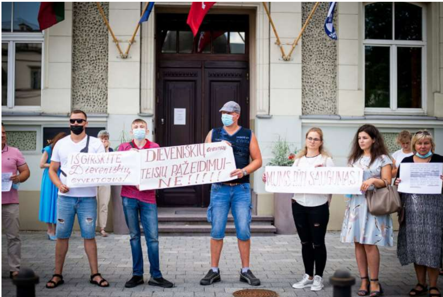
Protestas prieš migrantų apgyvendinimą Dieveniškėse

Moteris pabrėžia, kad geresnio gyvenimo link žmonės bėgo visą gyvenimą, nuo to nesiskiria nei europiečiai, nei kitų žemynų gyventojai. Tačiau iškilus tokioms situacijoms svarbu ieškoti sprendimo, o juo kartais gali tapti ir paties žmogaus iniciatyva - pavyzdžiui, kaip Dieveniškėse įvykęs paprastas ir nuoširdus pokalbis.